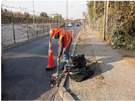
Limpieza de Cunetas y Soleras.